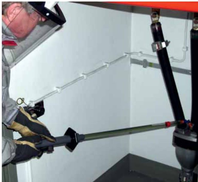
Forró kiöntőmassza feszültség alatti utántöltése